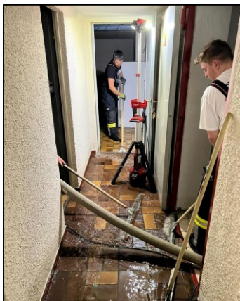
Überfluteter Keller - Au

Im September führte der anhaltende Regen zu zahlreichen Einsätzen. Diese reichten von Sicherungsarbeiten nach Überflutungen, technischer Einsatzleitung, die in enger Abstimmung mit dem Bürgermeister stattfand, bis zu den Reinigungsarbeiten nachdem das Wasser abgeflossen ist.