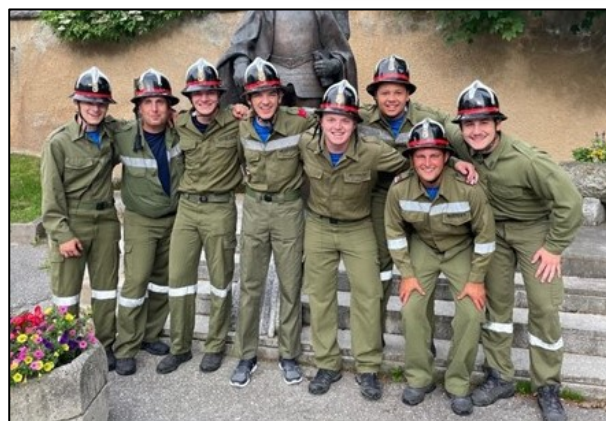
Bewerbsgruppe – Redlham 2