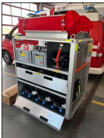
Rollcontainer „RC LPA-Tunnel“