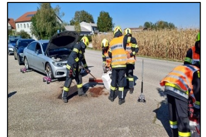
Ölspur – GWP West

Einsätze“ fallen unter anderem zwei Tierrettungen, eine Personensuche, die Beseitigung von Ölspuren und auch das präventive Hochwasservorbereitungen durch das Füllen von Sandsäcken. Weiters wurden zwischen Juni und September 21 Einsätze aufgrund von Wespen und Hornissennester abgearbeitet.