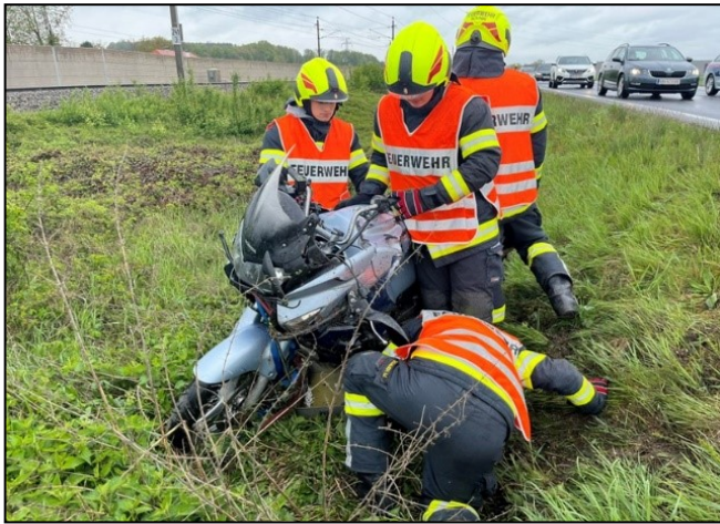
Verkehrsunfall – B1 GWP West

B1. Diese reichen von Fahrzeugen, die im Kreisverkehr Gewerbepark Ost verunglücken, bis hin zu größeren Kollisionen im Bereich B1 Gewerbepark West. Darüber hinaus mussten zwei Fahrzeuge von einer Böschung beim Gasthaus Schatzl geborgen werden.