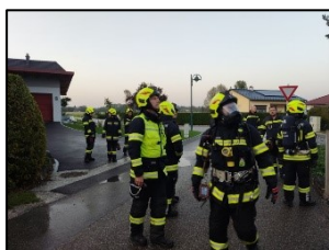
Brandverdacht - Au

Im Jahr 2024 hatten wir mehrere Einsätze bei der Firma Energie AG Umweltservice GmbH, darunter einen Akku-Brand in der EBS Halle am 8. März, einen Brand von Gewerbemüll am 17. Mai und einen Brand im Kartonlager am 4. Juni abzuarbeiten.