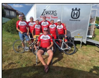
Lakers Cycling Team

Am Stöbeltturnier der FF Schlatt haben 2 Mannschaften mitgespielt und das Lakers Cycling Team nahm, im neuen Rad Dress, an der 31. Feuerwehr Rad Staatsmeisterschaft in Friedberg teil.