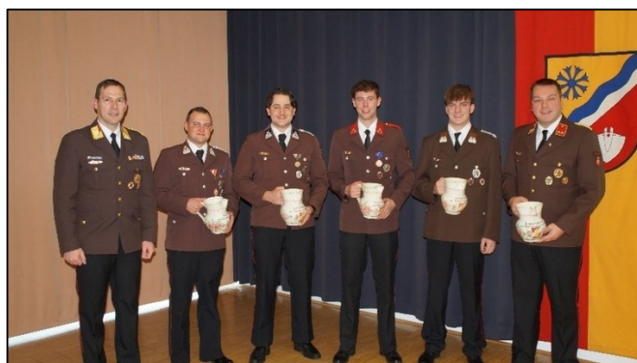
FKAE Gold Teilnehmer