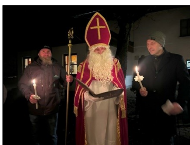
Weihnachtsfeier Gasthaus Schatzl

Am 07. Dezember lud das Kommando zur traditionellen Weihnachtsfeier beim Zigeunerwirt. Beim Kommandanten-Empfang genossen wir bei weihnachtlicher Stimmung Glühwein